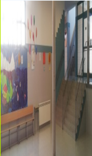
RECIBIDOR CEIP "ALONSO RODRÍGUEZ"

El CEIP Alonso Rodríguez invita a toda su comunidad educativa a las II Jornadas de Puertas Abiertas.